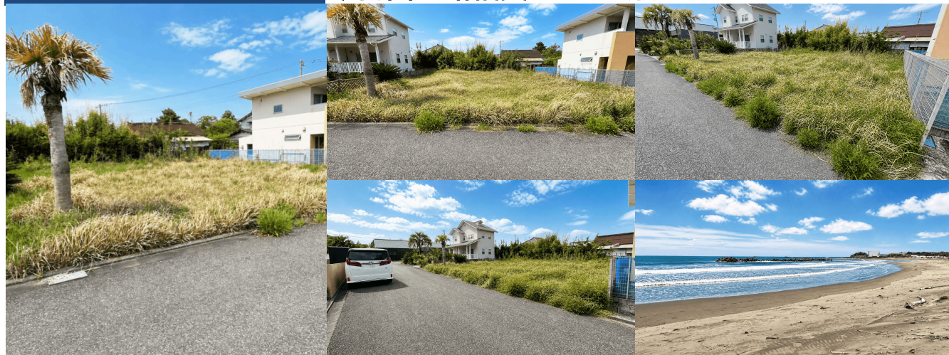
< 接道状況 >